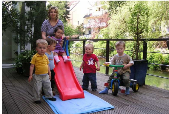
Spielbereich Terrasse

in den Stiftspark) unternommen. Wir achten auf eine gesunde Ernährung und möchten zu einer positiven Persönlichkeitsentwicklung der Kinder beitragen. Die Förderung von Kreativität, Motorik, das Erlernen selbstständige Entscheidungen treffen zu können und der positive Umgang mit anderen sind für uns hierbei besonders wichtig. Erziehungsinhalte vermitteln wir spielerisch, aber konsequent. Es gibt wenige kindgerechte Regeln. Ein regelmäßiger Austausch zwischen Ihnen und uns hilft Ihrem Kind, sich in beiden Familien wohl zu fühlen.